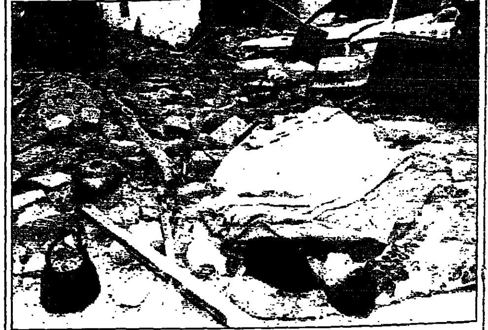
● غطف من البربر ينام على أنقاض المنزل الذي دمره الزلزال في بلدة نازكا والذي بلغ قوته ٧.٣ درجة على مقياس ريختر وأصبح ٢٥ ألف نسمة من سكان البلدة بلا مأوى.